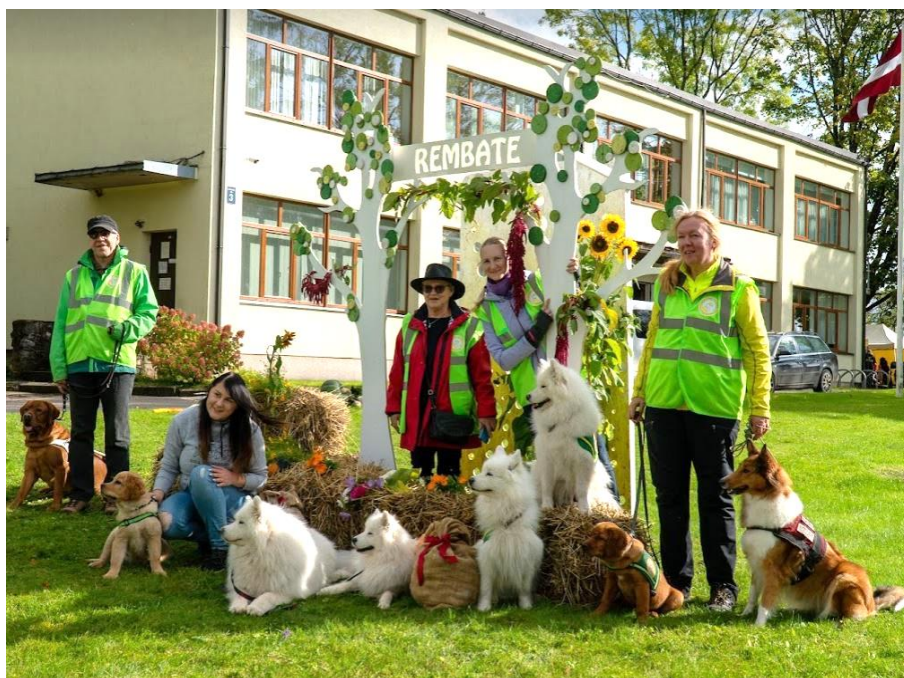
2021.gada rudenī biedrība ciemojās Rembatē